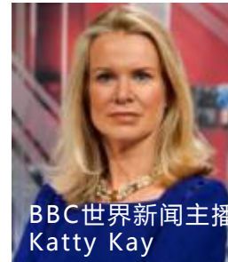
BBC世界新闻主播 Katty Kay